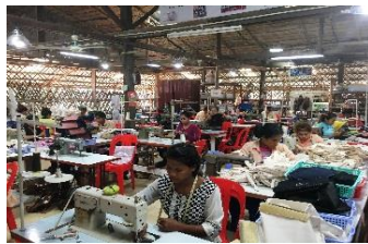
<かものはプロジェクト活動現場/イメージ>