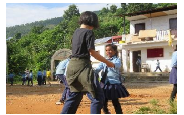
<タケオ州村人との交流会/イメージ>

時間帯の目安 早朝=04:01-06:00 朝=06:01-08:00 午前=08:01-12:00 午後=12:01-18:00 (昼=12:01-14:00 夕刻=16:01-18:00) 夜=18:01-23:00 深夜=23:01-04:00