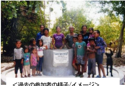
<過去の参加者の様子/イメージ>