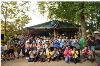
<スバエク孤児院/イメージ>

カンボジア査証(VISA)および、代行取得する場合は別途手数料が必要となります。